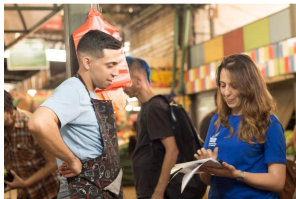
Venezolano siendo entrevistado por personal del ACNUR durante uno de los ejercicios de monitoreo de protección en Santiago de Chile

Sólo un 5% de las personas entrevistadas reportó haber solicitado la condición de refugiado, de las cuales un 3% reportó que su solicitud fue denegada. El 36% manifestó no considerarlo necesario o aplicable a su caso, y el 73% indicó no tener la intención de hacerlo. Otro 25% indicó no tener información sobre el sistema de asilo en Chile. El ACNUR infiere que el desconocimiento sobre el sistema de asilo en Chile es uno de los factores relevantes que explica el hecho de que la población venezolana no esté aplicando a la condición de refugiado en el país; los mismo ha sido constatado a través de reuniones con asociaciones de venezolanos, y otros contactos y encuestas con la población.