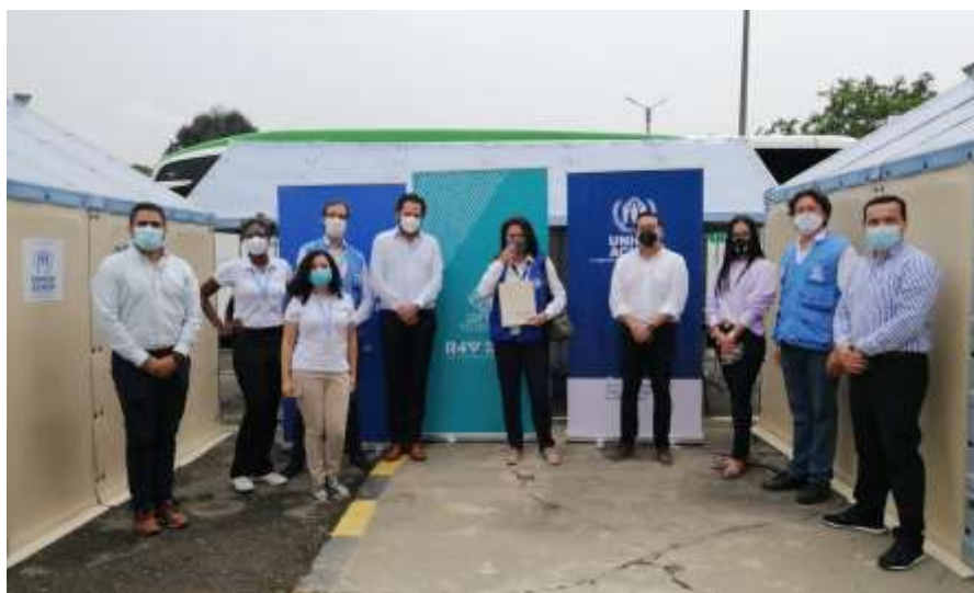
La coordinación del GIFMM local estuvo acompañando al Gerente de Fronteras y funcionarios del Gobierno Nacional durante la visita a terreno en Valle del Cauca.