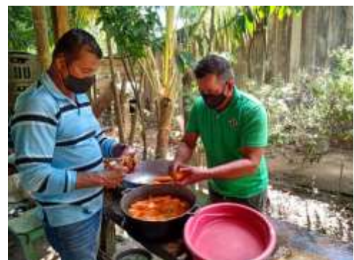
Taller en educación alimentaria y nutricional para refugiados y migrantes en Bocas de Jujú, en Arauca.