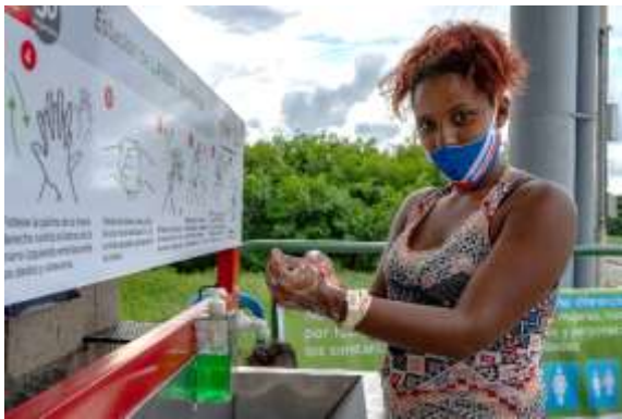
Asistencia a refugiados y migrantes mediante puntos de lavado de manos.

Durante el mes de noviembre 366.700 beneficiarios recibieron una o más asistencias a través de 33 socios e implementadores del RMRP en agua, saneamiento e higiene, en 39 municipios de 15 departamentos. El sector dio respuesta con agua, artículos de higiene, kits de inundaciones y reparaciones a algunos sistemas de agua en las comunidades de los asentamientos informales en los departamentos de Atlántico, La Guajira, Norte de Santander y Arauca que se vieron afectados por inundaciones, daños a las viviendas y a los servicios WASH por las fuertes lluvias y debido al paso de los huracanes Eta e Iota. Ante el aumento de ingresos a Colombia de refugiados, migrantes y retornados por Norte de Santander y Arauca se incrementó la respuesta con agua y entrega de artículos de higiene a las personas en las rutas de caminantes.