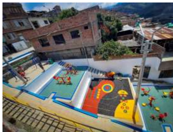
Mejoramiento de estructuras comunitarias para los refugiados y migrantes en Cali, Valle del Cauca.

Más de 27.100 personas accedieron a artículos de hogar (p.ej. kits de cocina y menaje de hogar). De igual manera, más de 12.100 lograron acceder a alojamiento colectivo e individual, y más de 5.300 accedieron a servicios de transporte humanitario.