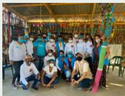
Jornada de entrega de mercados en La Guajira.

Con el fin de dar una mayor atención a los refugiados y migrantes provenientes de Venezuela, War Child y su programa “¡Juntos más seguros!” hizo apertura de tres espacios seguros de protección en el asentamiento Aeropuerto de Uribia, en el departamento de La Guajira. Sin embargo, para llegar a más población y atender sus necesidades War Child hizo una alianza con Aldeas Infantiles, también presente en este asentamiento con dos espacios de protección y educación, para así integrar esfuerzos y dar atención integral a todas las personas.