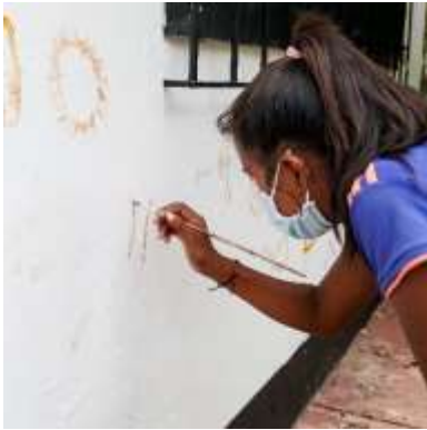
Niñas y niños indígenas y refugiados y migrantes decoraron con dibujos y símbolos las paredes del espacio protector Cachicamo inaugurado en Vichada, en donde aprenden y mantienen vivas sus tradiciones.

Por otra parte, más de 54.000 refugiados y migrantes recibieron información en prevención y respuesta ante violencias basadas en el género, y más de 2.700 personas fueron capacitadas en prevención y respuesta a esta clase de violencias, en particular aquellas en contextos de flujos migratorios mixtos. Igualmente, 15 refugiados y migrantes recibieron asistencia de protección en contextos de doble afectación.