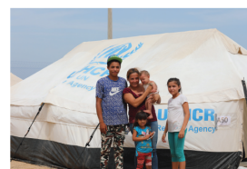
El ACNUR en Bogotá. La Agencia presta apoyo y protección al Estado de Colombia frente al IDP (Refugiados).

Colombia está pasando por una transición y reconfiguración importante con la implementación del Acuerdo de paz con las FARC firmado en 2016. A la vez, el país enfrenta retos humanitarios significativos, generados por la llegada masiva de refugiados y migrantes de Venezuela, así como por los desplazamientos internos que se siguen generando. ACNUR en Colombia apoya al Estado colombiano en sus esfuerzos de promover protección y acceso a soluciones duraderas para desplazados internos y población proveniente de Venezuela.